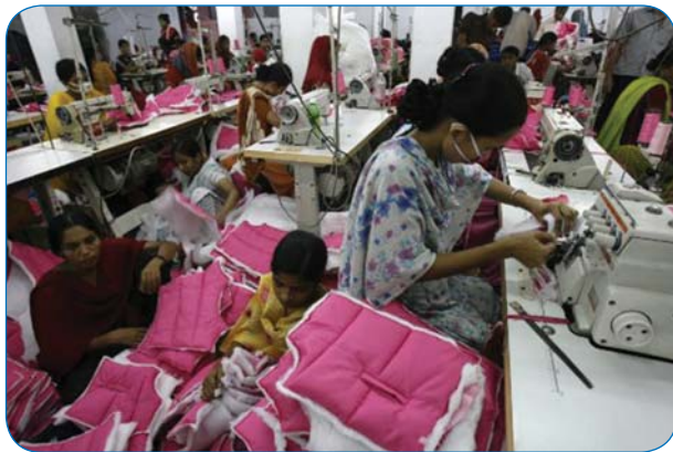
منبع: Fibre2fashion ترجمه: مهندس حمیده نشکری شاد

به گزارش دفتر مطالعات آماری و راهبردی انجمن صنایع نساجی ایران و به نقل از نشریه fibre2fashion دولت بنگلادش مالیات بر درآمد حاصل از صادرات پوشاک آماده این کشور را از ۰/۳ به یک درصد افزایش داد. وزیر دارایی این کشور در روز ۴ ژوئن در حالیکه بودجه سال مالی ۱۶-۲۰۱۵ را اعلام می کرد از این افزایش در مالیات پوشاک آماده خبر داد. صادرکنندگان پوشاک آماده به سرعت